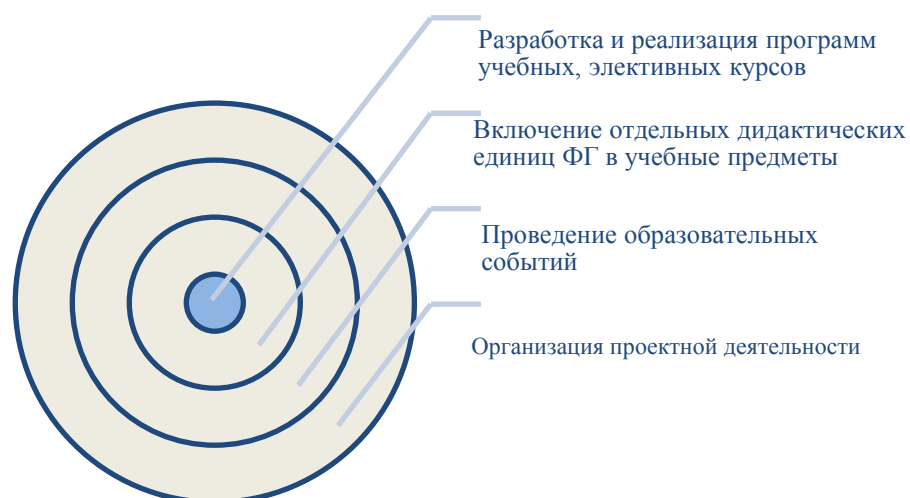
Модель повышения финансовой грамотности обучающихся 8-9 классов Лицея им. Г.Ф. Атякшева